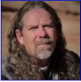
Will Schryver @imetatronink

When the Chickens Come Home to Roost Es hat etwas mehr als ein Jahrhundert gedauert, aber die Bedingungen der schlecht durchdachten Teilung des Osmanischen Reiches nach dem Ersten Weltkrieg werden nun erneut überprüft. Sie wird nicht friedlich verlaufen.