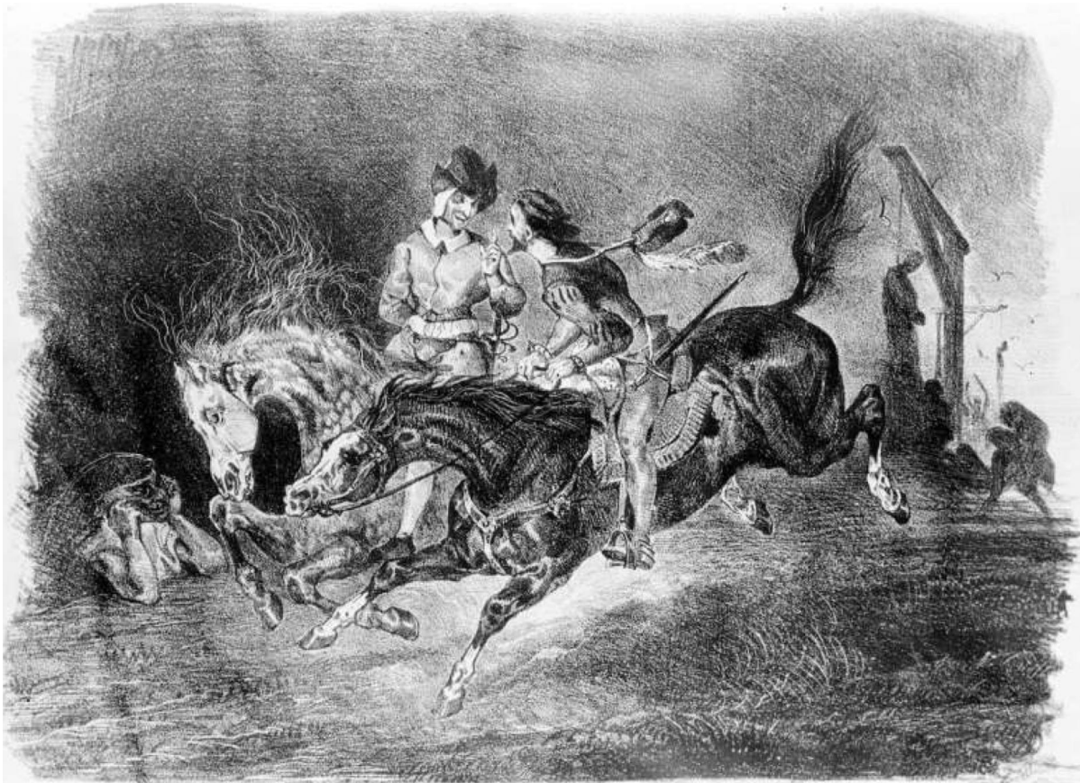
Der Ritt von Faust und Mephistopheles: Lithografie von Delacroix (1828); beachten Sie den Galgen im rechten Hintergrund.

Es gibt nichts Schmerzloses oder Angenehmes an Fausts großem Projekt. Ganz im Gegenteil: Faust ist zu großer Grausamkeit fähig. Seine Befehle haben einen tragischen Ausgang: Ein altes Ehepaar muss vertrieben werden, um Platz für das Projekt zu schaffen, und Fausts Aufpasser, der Teufel Mephistopheles, tötet sie.